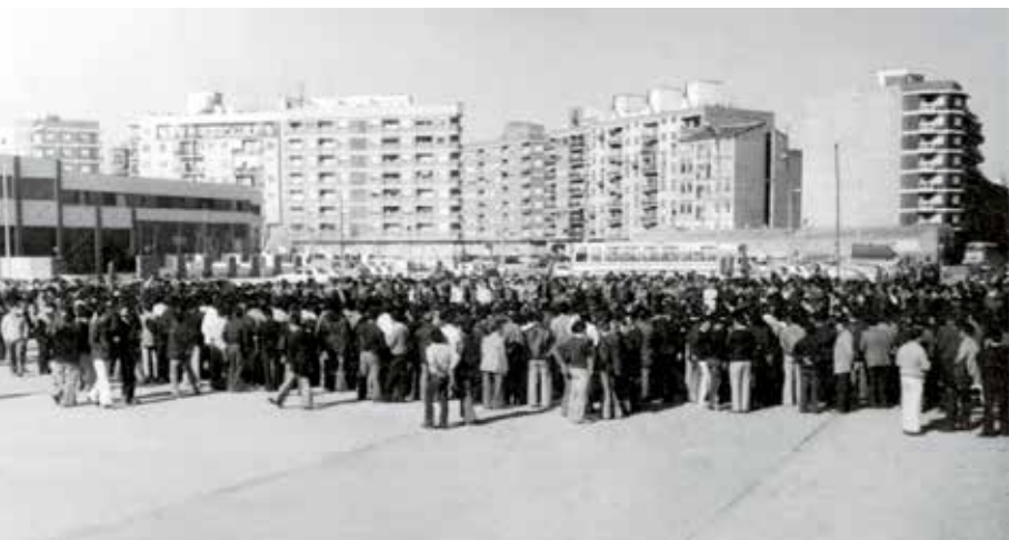
Asamblea de trabajadores de la construcción junto a la Avenida de La Plata, en Valencia.

Una serie de movilizaciones previas a la huelga de Alicante, de la construcción junto a otros sectores en diciembre de 1975 y enero de 1976, contribuyeron con su ejemplo a crear un ambiente reivindicativo. Las experiencias se difundían por la prensa, que ahora satisfacía la demanda de noticias con más detalle. El conocimiento de otras luchas transmitido por las redes de grupos organizados animaba a conseguir mejoras largamente esperadas. Así sucedió con las plataformas defendidas en Madrid y Valencia. En ellas se fijaron los puntos más exigidos por las bases: salario mínimo semanal y amnistía sindical. A la escalada inflacionaria que mermaba rápidamente los salarios reales, las largas jornadas a menudo por encima de las 45 horas semanales de lunes a sábado y las deficientes medidas de seguridad e higiene que provocaban accidentes y enfermedades profesionales, se unían las presiones, listas negras y discriminaciones a los obreros contestatarios por parte de algunas empresas.