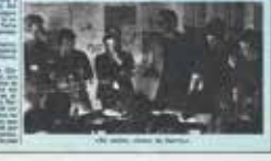
Los obreros de la construcción en una reunión.

En el segundo día de huelga, el día 29 de abril, se continuó con los paros en todas las ciudades. Los trabajadores de la construcción se presentaron en sus respectivos lugares de trabajo, pero no comenzaron a trabajar.